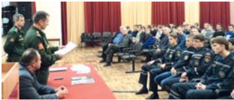
О преимуществах профессии офицера учащиеся узнали на тематических встречах

В рамках Всероссийской Информационно-агитационной акции «Есть такая профессия - Родину защищать!» в Золотухинском районе с 24 октября 2016 года проводятся мероприятия по военно-профессиональной ориентации учащихся выпускных классов и курсов образовательных учреждений.