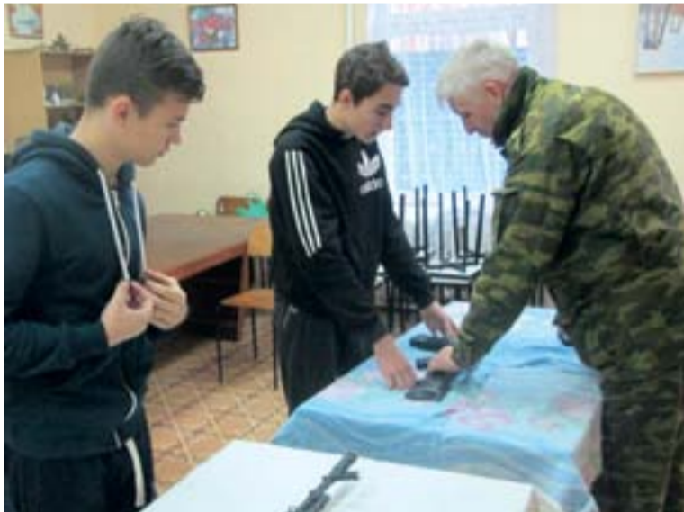
Лучший результат наша команда показала в конкурсной программе

Всего на этих соревнованиях было 4 этапа: полоса препятствий, техническая трасса, конкурсная программа и комплексное игровое упражнение. Лучший результат наша команда показала в конкурсной программе, где были следующие задания: сборка и разборка