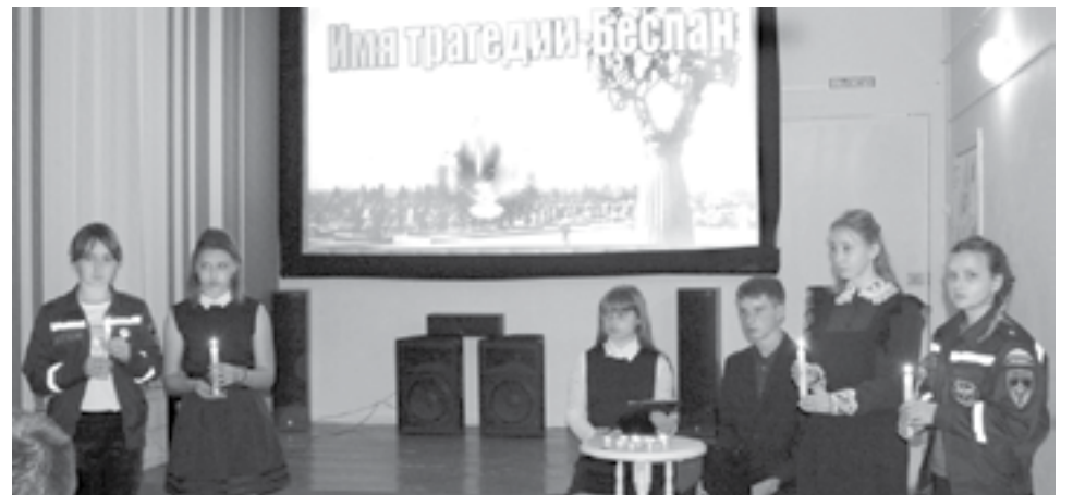
Школьники посвятили свой классный час памяти жертв Беслана