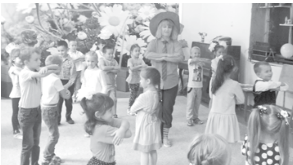
Герои детских книг играли и танцевали с детьми

Н ачало учебного года - праздник не только у школьников, дошколята после веселого лета пришли в детский сад загорелые, повзрослевшие, улыбочные и нарядно одетые. В первый день осени все дружно встретили праздник, посвящённый Дню знаний.