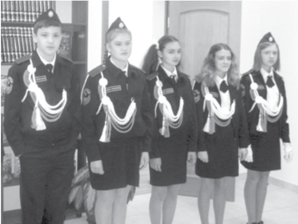
Юные кадеты прочитали стихотворения о флаге России