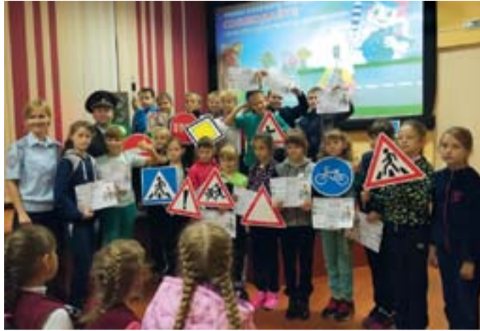
Классный час по Правилам дорожного движения