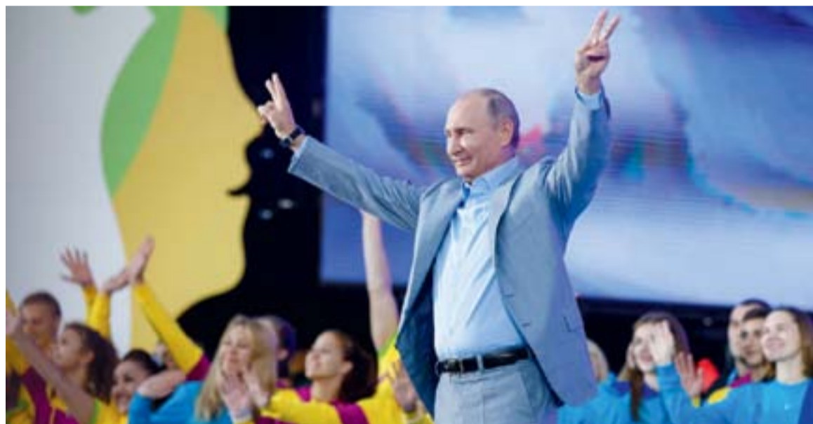
Участников фестиваля приветствует Президент РФ В.В. Путин

И курская молодёжь показала высокий уровень во всех направлениях деятельности Всемирного фестиваля молодёжи и студентов. Курск звучал везде. Участники нашей делегации успели отличиться едва ли не на всех площадках фестиваля: слушали образовательные лекции, задавали вопросы экспертам, занимали призовые места в спортивных мероприятиях и конкурсах, презентовали вокальные и хореографические номера. Мы посе-