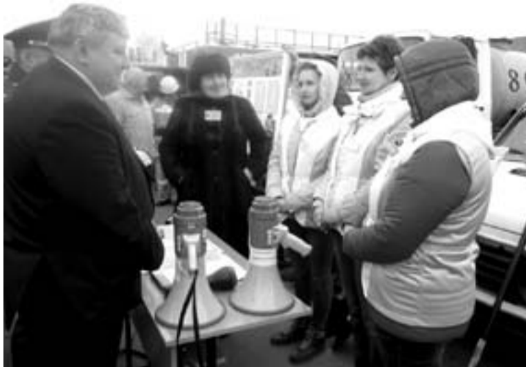
Дмитриевцы приняли участие в областном смотре-конкурсе документов, фотоматериалов.

Муниципальные образования Золотухинского района приняли участие в областном смотре-конкурсе на лучший орган местного самоуправления муниципальных образований в области обеспечения безопасности жизнедеятельности населения в 2017 году.