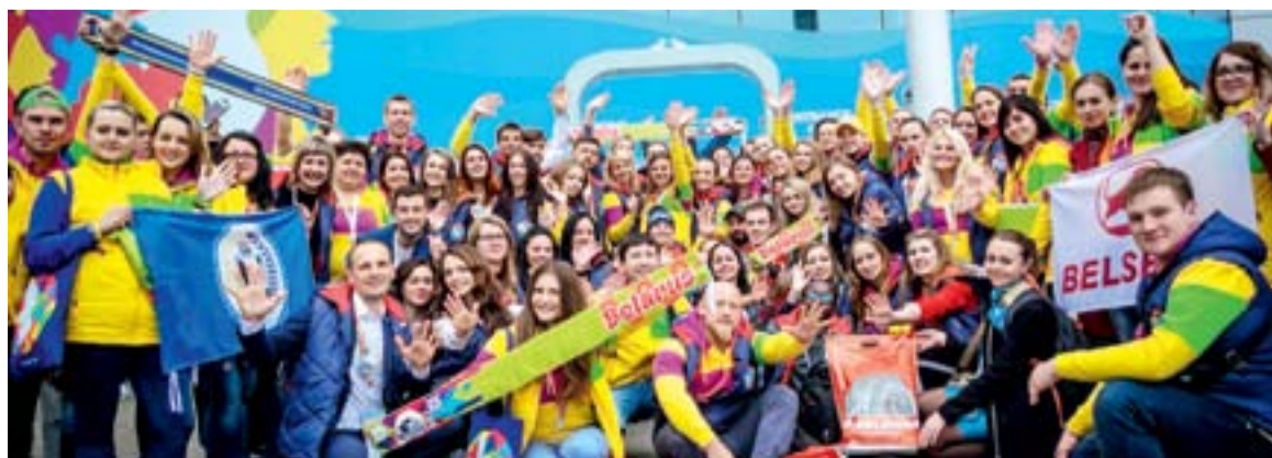
Делегации Курской области и Республики Беларусь