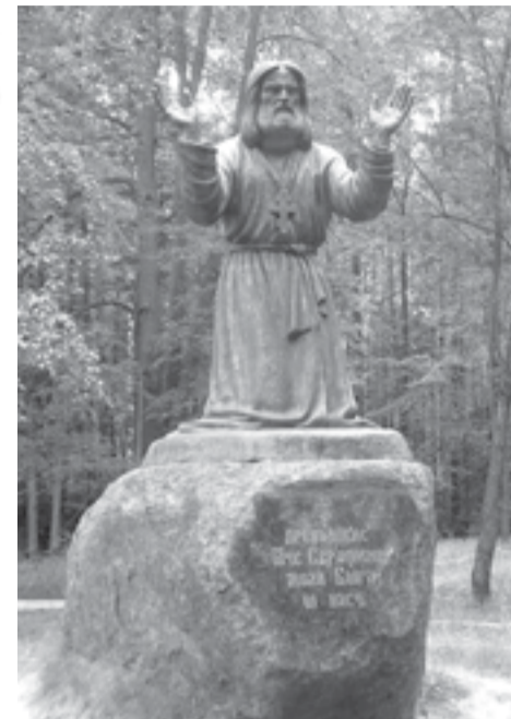
В 1991 году наш земляк, известный скульптор Вячеслав Михайлович Клыкков, изготовил памятник преподобному Серафиму Саровскому

Чтобы обозначить место Дальней пустыньки, в 1990 году члены исторического объединения «Саровская пустынь» на её месте поставили деревянную часовню с крестом. В 1991 году наш земляк, известный скульптор Вячеслав Михайлович Клыкков, изготовил памятник преподобному Серафиму Саровскому и решил установить его на Дальней пустыньке. После установки памятника городские власти благоустроили это место. В 2000 году с помощью Ядерного центра здесь поставили каменную часовню с навесом, а к столетию прославления преподобного старца Серафима на месте найденного каменного фундамента построили деревянную избу, копию избы 1903 года, где круглосуточно горят лампадки у икон отца Серафима и Божией Матери «Умиление».