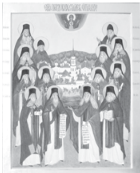
Собор преподобных Оптиных старцев

«Саров и Оптина - вот два самых жарких костра, у которых грелась вся Россия», - писал в XIX веке историк, философ и публицист Георгий Федотов. И греется - добавлю я сейчас, в веке XXI-м.