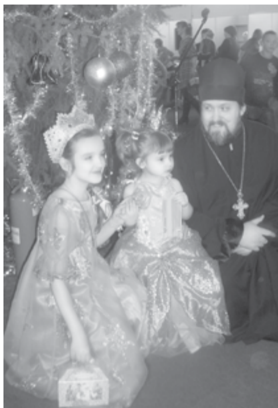
Детский праздник у Рождественской ёлки в местечке Свобода