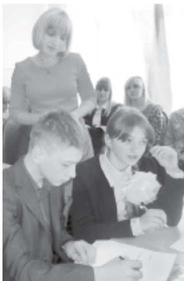
Урок английского языка

На базе Седмиховской средней школы прошёл районный семинар учителей иностранного языка по теме «Использование активных форм урочной и внеурочной деятельности для повышения мотивации к изучению иностранного языка».