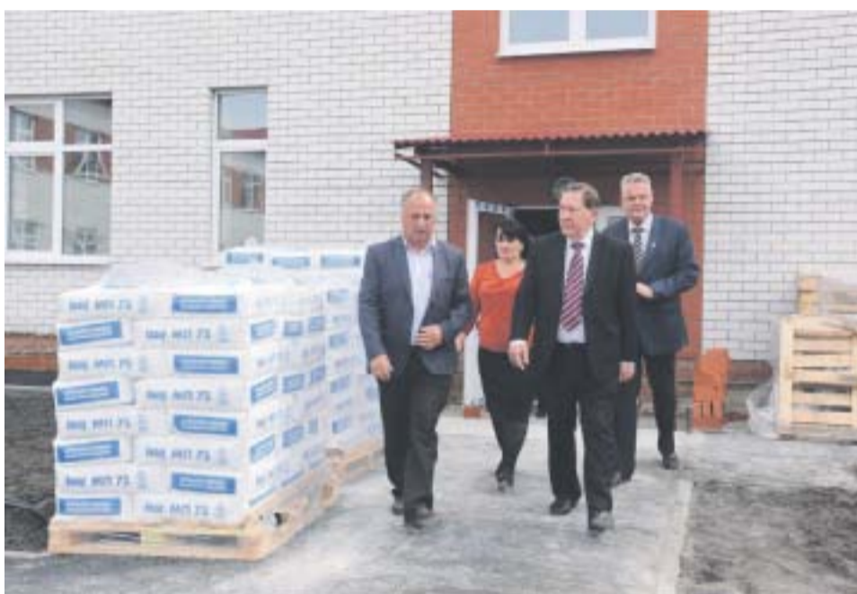
Строительство школы в деревне Жерновец началось в 2014 году

1 сентября образовательное учреждение открыло двери для учеников. В торже-