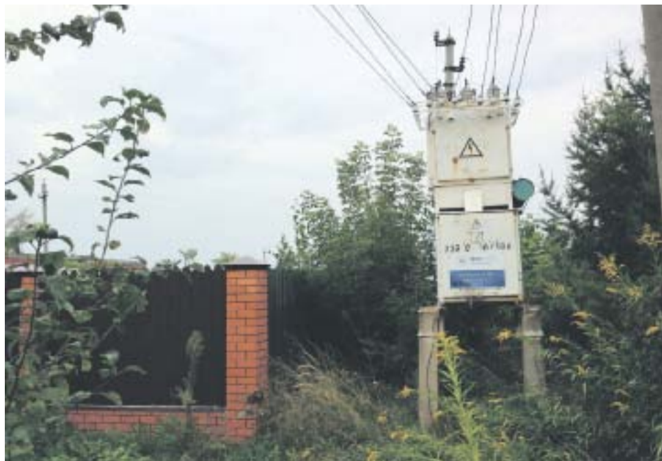
Вызывает опасения старая трансформаторная подстанция