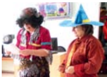
Сказочные герои в гостях у первоклассников играх и конкурсах, читали стихи.

гости наша библиотека. Ребята вместе со сказочными героями - Почтальоном Печкиным, Бабой Ягой - пели песни, отгадывали загадки, участвовали в различных