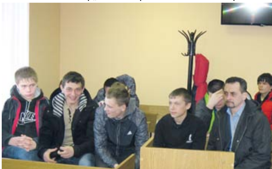
...а ребята имели возможность задать интересные их вопросы

основания отмены или изменения назначенного наказания, не связанного с лишением свободы. Он также отметил, что с 2018 года в районных судах вводится институт присяжных заседателей.