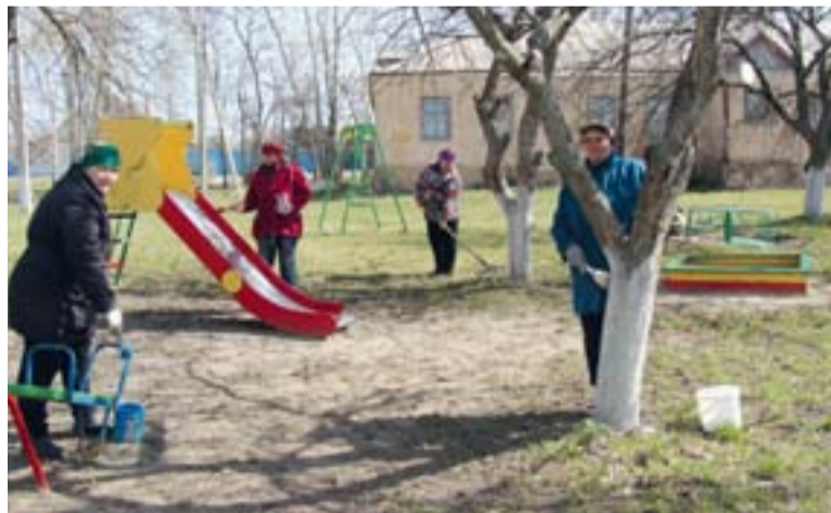
Апрельский субботник в Зиборовском саду на День Земли - благоустройство детской площадки

В этот день жители Дмитриевского сельсовета приняли активное участие в благоустройстве детских площадок д. Зиборова, д. 2-е Конёво, с. Дмитриевка, наведению санитарного порядка своих дворовых территорий и территорий, прилегающих к ним. Жители деревни Сухая Неполка под руководством старше-