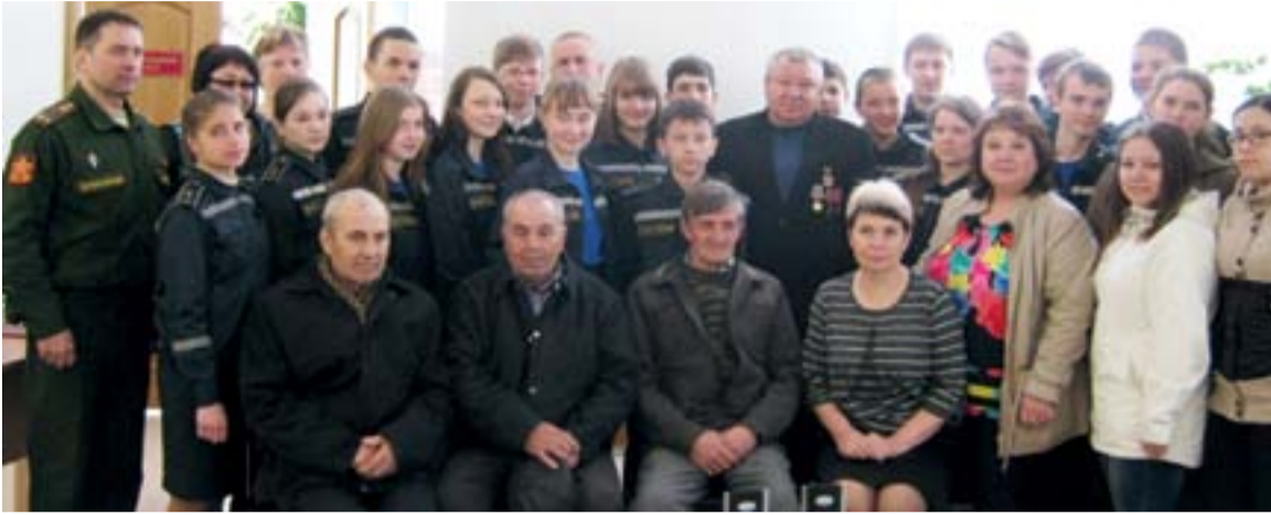
После окончания встречи школьники сфотографировались на память с гостями мероприятия

В межпоселенческой библиотеке Золотухинского района прошло мероприятие, посвящённое 31-й годовщине со дня крупнейшей аварии на Чернобыльской атомной электростанции. В нём приняли участие обучающиеся 8 «Б» и 9 «Б» классов Золотухинской средней школы. Почётными гостями стали ликвидаторы аварии на ЧАЭС.