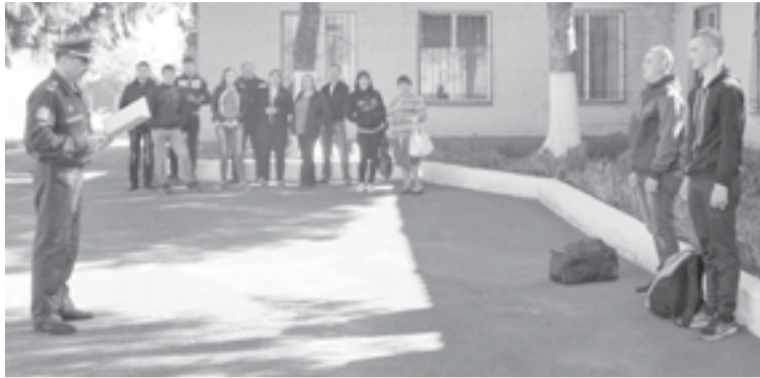
Стройные ряды сотрудников следственного комитета

Сегодня органам следствия исполняется более трёхсот лет, в связи с этим было интересно посмотреть, как работает данная структура власти на примере Золотухинского межрайонного отдела. Помимо данного района, в его юрисдикцию входят территории Фатежского и Поньровского районов. Коллектив состоит