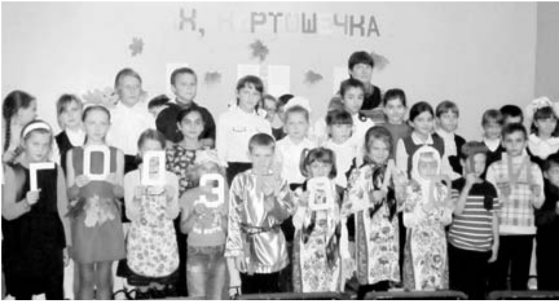
Участники праздника «Ах, картошечка!»