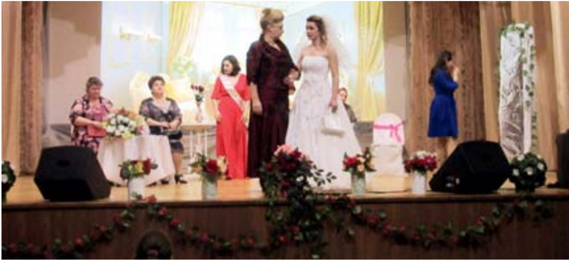
Спектакль прошёл на одном дыхании