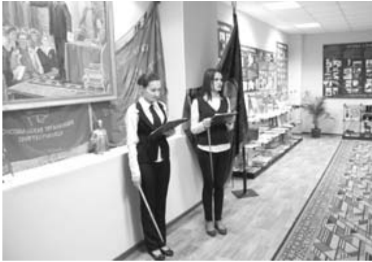
Экскурсоводы-обучающиеся проводят экскурсию

Сохранение лучших традиций образовательного учреждения для обеспечения преемственности поколений, формирование позитивного отношения к истории малой родины - приоритетное направление воспитательной работы Свободинского аграрно-технического техникума. Благодаря деятельности творческого объединения «Наследие» здесь реализуются проекты гражданско-патриотического воспитания молодежи. Экспозиции музейного уголка рассказывают о ветеранах педагогического труда, Героях Великой Отечественной войны, о ветеранах педагогического труда, о ветеранах педагогического труда, о ветеранах педагогического труда.